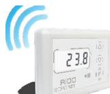
Комнатный термостат Komfort 121