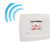
Комнатный термостат Komfort 161